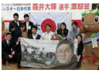
大会前の市役所での激励会の様子