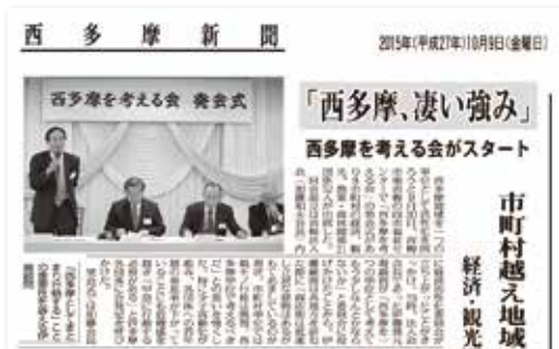
平成27年9月の同会発足を報じる報道記事。少子高齢化、地域間競争に立ち向かうために「西多摩を一つの単位として考え取組めないか？」をテーマに会発足が呼びかけられた。「西多摩新聞」2015年10月9日号1面より

今回の出版事業の資金調達においては新しい試み、クラウドファンディングを実施。約2百万円をネットで集めたといいます。企業、団体等の協賛、約2百万円と合わせ3千部が完成。千部が地域の書店、ネット販売でも扱われています。