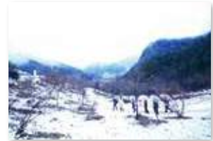
雪降る中の奥多摩取材。「寒かったけど民話の宿・荒澤屋の温かいお料理が良かったです」と小崎編集長

少し外側から西多摩を観るという取材スタッフの目線で紹介されているイベントや祭事の内容は、観光客にも訪れる喜びを深めてくれます。