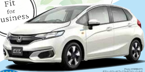
Photo: HYBRID(FF) ボディカラーはプレミアムホワイトパールII (有料色:32,400円増) 車両本体価格 169,992円* (消費税8%込み)