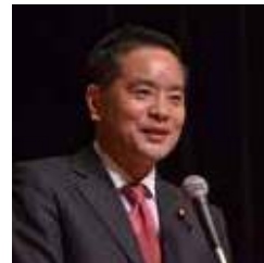
岸田氏の学校の後輩にあたる井上信治衆議院議員。講演会の立役者でもある。