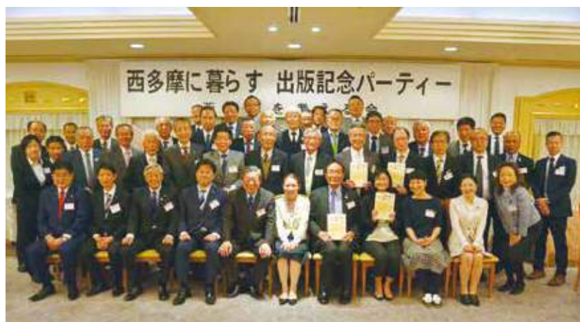
完成を祝う「西多摩を考える会メンバー」。地域政治関係者、経済団体、農林漁業関係者など西多摩地域の21団体が組織されている（写真は来賓も含む）