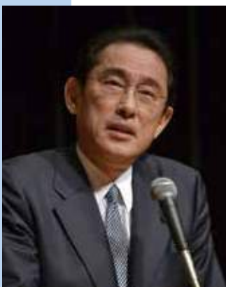
岸田さんは1993年の衆議院議員総選挙で初当選し8期連続当選。2007年、第一次安倍改造内閣で内閣府特命担当大臣として初入閣し、第二次安倍内閣では外務大臣を4年8か月務め、戦後最長を記録した。

今後の外交の課題について「北朝鮮問題はミサイルなどですっかりとした備えが大事。日米同盟で守ることと国連と協力して外交を通じて日本に好ましい環境を作るべき。対話へは核放棄させるための圧力をかけて北から対話を申し込ませることだ。日中関係は平和条約40周年の年。両首脳相互訪問ができるかに注目したい。TPPなどの経済関係でも各国と連携し外交の成果を挙げて来年に繋げることが大切。G20で初の議長国となり、アフリカ支援会議やラグビーワールドカップの開催などで諸外国から要人が多数来日する。テロや治安対策など含めて日本の底力が試される年。課題解決して来年につなげるのが今の日本外交の有り様ではないか」と結び終了しました。