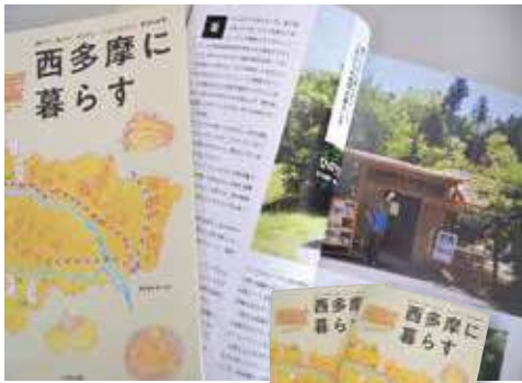
B5判144頁、 定価1200円税別、 編集、発行「けやき出版」

西多摩地域8市町村の四季の自然伝統文化、その地で働く人々の思い、様々な楽しみ方、喜びを網羅した「西多摩に暮らす」が、平成30年2月末に発行されました。大手の出版社が作るガイドブックとは一味違った同書籍の魅力を紹介します！