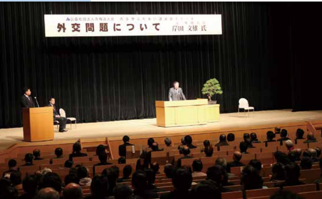
会場からも熱心な質問が寄せられた講演会後半